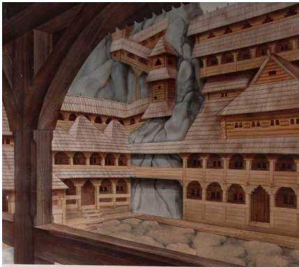
Виглядний двір дотепер