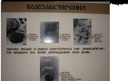
ЗАПАС ВОДИ У ДВОХ ЦИСТЕРНАХ МІГ ЗАБЕЗПЕЧИТИ ВОДОЮ 50 ВОЛІВ ВПРОВОДЖ 200 ДНІВ.